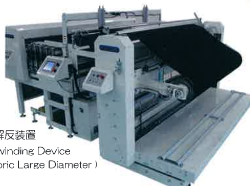
シート用大径解反装置 Sheet Dedicated Unwinding Device ( Corresponding to the Fabric Large Diameter )