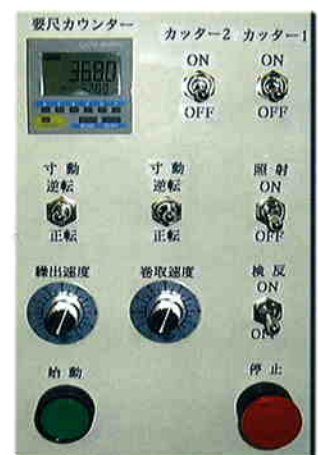
操作パネル Operation Panel

* 上記以外の仕様もご相談によりお応え可能となっております。 Other specifications are also available for requesting.